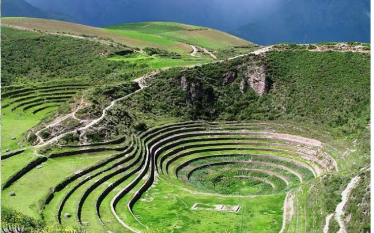
บ่าย นำท่านเดินทางสู่ มาราซ (Maras) แหล่งผลิตเกลือที่คุณภาพดีที่สุดในโลก ที่มีมาตั้งแต่สมัยอินคา แนวนาขั้นบันไดที่เรียงอยู่ตามลำดับความสูงของภูเขา จากนั้นเดินทางสู่ โมเรย์ (Moray) นาขั้นบันไดวงกลมขนาดใหญ่หลายๆรูปร่างแปลกตาที่ชาวอินคาทำไว้เพื่อทดลองปลูกพืชพันธุ์ต่างๆ จากจุดนี้สามารถมองเห็น หมู่บ้านอูรัมบัмба (Urubamba) ได้อีกด้วย ได้เวลาเดินทางกลับสู่เมือง เมืองคัสโก (Cusco) เมืองหลวงของอาณาจักรอินคา ที่แพร่ขยายอำนาจจนกินพื้นที่ 1 ใน 3 ของอเมริกาใต้ ตั้งอยู่เหนือระดับน้ำทะเลถึง 3,400 เมตร และเป็นแหล่งอารยธรรมยุคก่อนประวัติศาสตร์ที่ลึกลับน่าทึ่ง เป็นชุมชนเก่าแก่ของจักรวรรดิอินคาอันรุ่งเรือง ซึ่งยังคงทิ้งร่องรอยความเจริญไว้ให้เห็นเป็นซากปรักหักพังโบราณและโบราณวัตถุต่างๆ