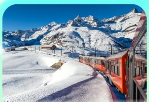
นั่งรถไฟสู่อยอดเขากรอนเนอร์เกรต