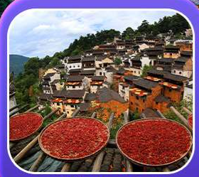
“หมู่บ้านหวงหลิง”

หุบเขาเทวดาวังเซียนกู่ หมู่บ้านที่ตั้งอยู่ริมหน้าผา • หมู่บ้านโบราณหวงหลิง ป่าสนน้ำชิงซาน • ล่องเรือทะเลสาบซีหู • ถนนโบราณตุ๋นจื่อ • ชมแสงสีที่ ฉู่หนีโจว