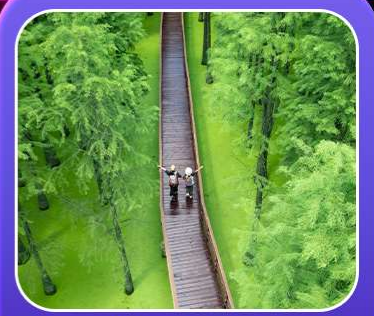
“ป่าสนชิงซาน”