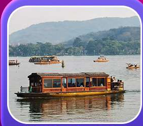
“ล่องเรือทะเลสาบซีหู”