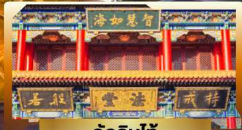
วัดจินไท่