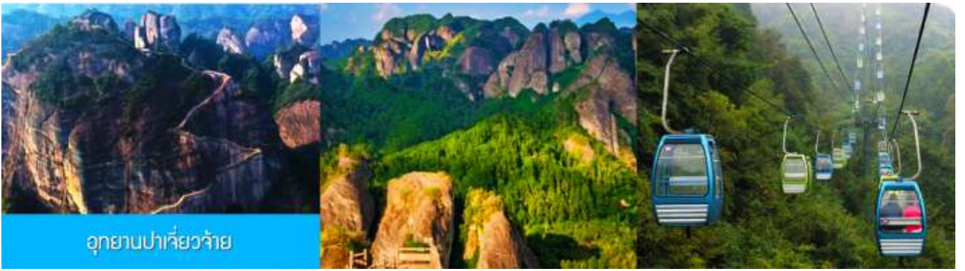
อุทยานปาเจียว้าย

หลังอาหารนำท่านเที่ยวชม อุทยานปาเจียว้าย 崑山八角寨 อุทยานท่องเที่ยวทางธรรมชาติแห่งนี้ ตั้งอยู่บริเวณรอยต่อระหว่างเขตเมืองกุ้ยหลินและมณฑลหูหนาน ประกอบด้วยยอดเขา(หินปูน)ใหญ่รวมแปดยอด มีหกยอดเขาอยู่ในเขตมณฑลหูหนาน ส่วนที่เหลืออีกสองยอดเขาอยู่ในเขตเมืองกุ้ยหลิน มียอดเขาลังซานเป็นยอดเขาหลักที่มีความสูง 818 เมตร มองแต่ไกลดูราวกับหัวมังกรที่ขีดหัวชี้ฟ้า อันเป็นที่มาของคำว่า ปาเจียว้าย (แปลว่า ขุนเขา เขาแปดแท่งหรือเขามังกรแปดหัว).....นำท่านนั่งกระเช้า (ค่าตั๋วรวมค่ากระเช้าขาขึ้นและขาลงแล้ว) ขึ้นสู่จุดชมวิวบนยอดเขา จากนั้นนำท่านเดินไปตามระเบียงชมวิวเพื่อเที่ยวชมจุดชมวิวต่าง ๆ บนยอดเขา อาทิ จุดชมทะเลหมอก จุดชมปลาวาฬพลิกตัว กองทัพหอยค่านับฟ้า ฯลฯ และนำท่านสักการะสิ่งศักดิ์สิทธิ์ ณ วัดหยุน ไถชื่อวัดเก่าแก่อายุหลายร้อยปีที่ตั้งโดดเด่นอยู่บนยอดเขา.....เมื่อควรแก่เวลา นำท่านนั่งกระเช้าลงจากยอดเขา