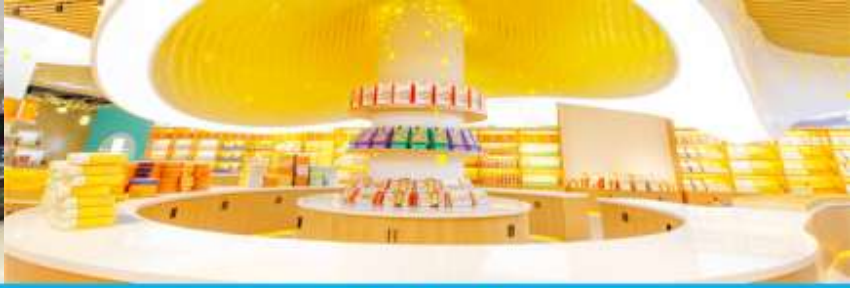
พิพิธภัณฑ์ดอกกุยฮวา

จากนั้นนำท่านเที่ยวชม พิพิธภัณฑ์ดอกกุยฮวา 桂花公社 ดอกกุยฮวาเป็นดอกไม้สีเหลืองที่มีกลิ่นหอม เป็นดอกไม้ประจำเมืองของกุยหลิน จะเบ่งบานในช่วงเดือนมิถุนายน – กรกฎาคมของทุกปี ในช่วงที่ดอกกุยฮวาเบ่งบานในเมืองกุยหลินจะคลุ้งไปด้วยกลิ่นหอมจากดอกกุยฮวา ทั่วเมืองกุยหลินจะเต็มไปด้วยสีเหลืองของดอกกุยฮวา ดอกกุยฮวาสามารถนำมาแปรรูปเป็นอาหารและเครื่องดื่มได้ และได้รับความนิยมจากชาวจีนตอนใต้เป็นอย่างมาก ชมพิพิธภัณฑ์ที่ทันสมัยด้วยระบบจัดแสดงที่ทันสมัย ภายในพิพิธภัณฑ์มีความโอ้อ่า มีการสาธิตและจำหน่ายผลิตภัณฑ์ที่ทำจากดอกกุยฮวา อาทิ ขนมดอกกุยฮวา ชาที่ทำจากดอกกุยฮวา และสินค้าพื้นเมืองอื่น ๆ