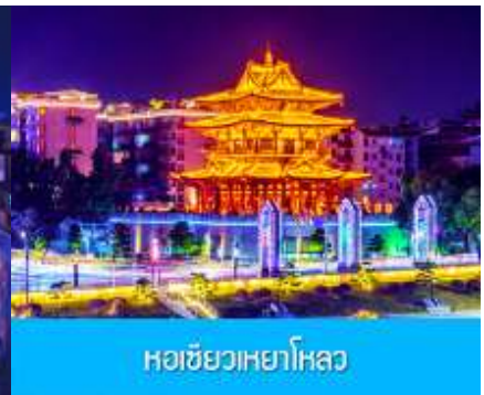
หอชิวเหยาไหลว