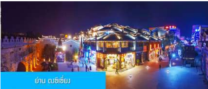
ย่าน ดงซีเจียง

จากนั้นนำท่านเที่ยวชม พิพิธภัณฑ์ดอกกุยฮวา 桂花公社 ดอกกุยฮวาเป็นดอกไม้สีเหลืองที่มีกลิ่นหอม เป็นดอกไม้ประจำเมืองของกุยหลิน จะเบ่งบานในช่วงเดือนมิถุนายน – กรกฎาคมของทุกปี ในช่วงที่ดอกกุยฮวาเบ่งบานในเมืองกุยหลินจะคลุ้งไปด้วยกลิ่นหอมจากดอกกุยฮวา ทั่วเมืองกุยหลินจะเต็มไปด้วยสีเหลืองของดอกกุยฮวา ดอกกุยฮวาสามารถนำมาแปรรูปเป็นอาหารและเครื่องดื่มได้ และได้รับความนิยมจากชาวจีนตอนใต้เป็นอย่างมาก ชมพิพิธภัณฑ์ที่ทันสมัยด้วยระบบจัดแสดงที่ทันสมัย ภายในพิพิธภัณฑ์มีความโอ้อ่า มีการสาธิตและจำหน่ายผลิตภัณฑ์ที่ทำจากดอกกุยฮวา อาทิ ขนมดอกกุยฮวา ชาที่ทำจากดอกกุยฮวา และสินค้าพื้นเมืองอื่น ๆ