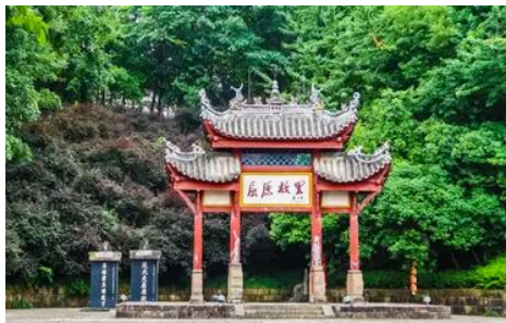
บ้านเกิดกวีซีหฺยวน