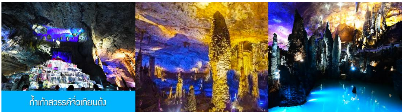
ถ้าเก๋าสวรรค์จิวเทียนตั่ว

พักที่ HANTING HOTEL ระดับ 4 ดาวท้องถิ่นหรือเทียบเท่าในเมืองจางเจียเจี๋ย