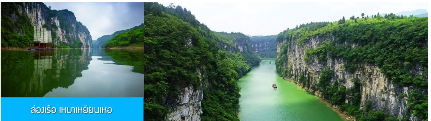
ล่องเรือ เหมาเหยียนเหอ