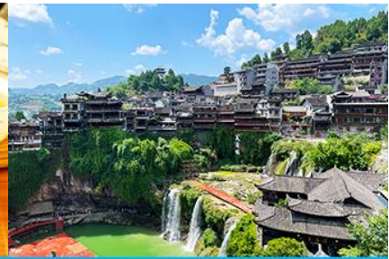
เมืองโบราณผู่หมิงเจี๋ย

วันที่สาม เมืองจางเจี๋ยเจี๋ย-ศูนย์แพทย์แผนจีน-ศูนย์จำหน่ายผลิตภัณฑ์ไชชา-ไกด์นำเสนอ OPTIONAL TOUR สะพานกระจกแกรนด์แคนยอน-เมืองโบราณผู่หมิงเจี๋ย