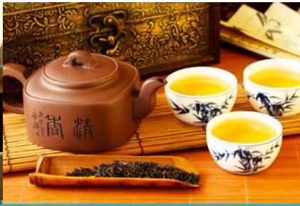
ศูนย์จำหน่ายผลิตภัณฑ์ไชชา