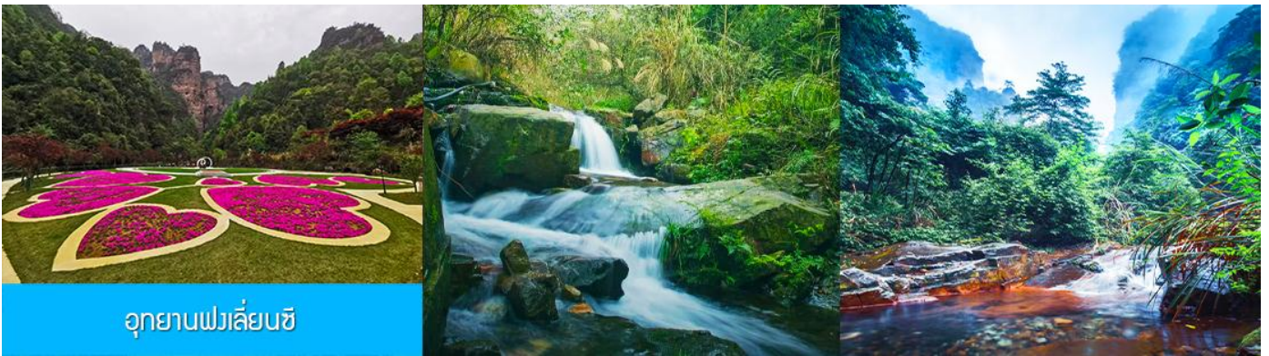
อุทยานฟงเลียนซี