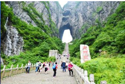
ประตูล้อมรอบ