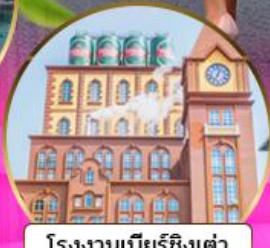
โรงงานเบียร์ชิงเต่า