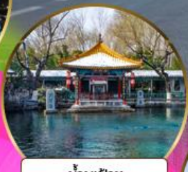
น้ำพุเป่าหู