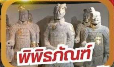
พิพิธภัณฑ์