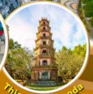
Thien Mu Pagoda