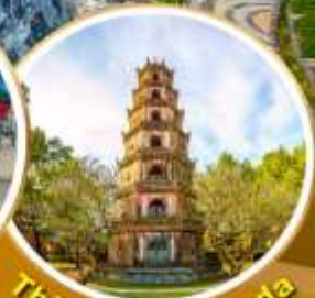
Thien Mu Pagoda