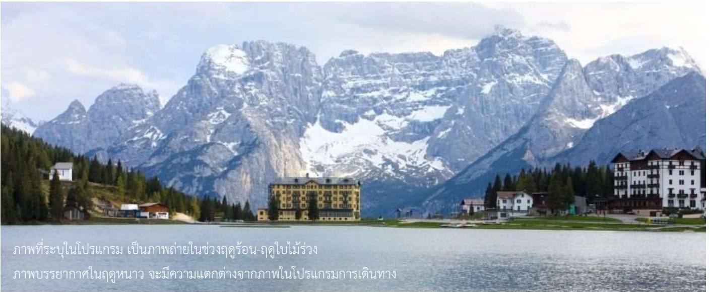
ภาพที่ระบุในโปรแกรม เป็นภาพถ่ายในช่วงฤดูร้อน-ฤดูใบไม้ร่วง ภาพบรรยากาศในฤดูหนาว จะมีความแตกต่างจากภาพในโปรแกรมการเดินทาง