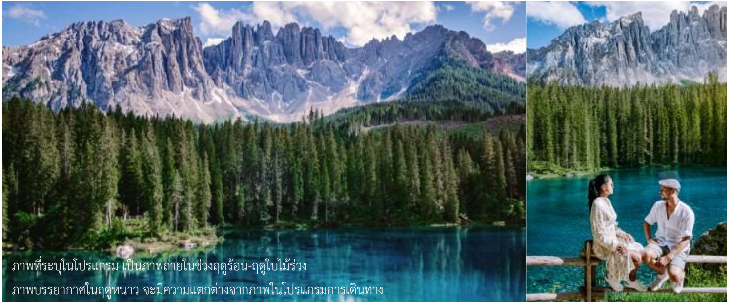
ภาพที่ระบุในโปรแกรม เป็นภาพถ่ายในช่วงฤดูร้อน-ฤดูใบไม้ร่วง ภาพบรรยากาศในฤดูหนาว จะมีความแตกต่างจากภาพโปรแกรมการเดินทาง

มองเห็นได้อย่างชัดเจนจากทุกมุมมอง ท่านจะได้ชมความงามของภูเขา Dolomites ซึ่งได้รับการขึ้นทะเบียนเป็นมรดกโลกจากยูเนสโก ถึงเวลาอันสามครรนำท่านเดินทางกลับลงมาที่ตัวเมืองออดิเซ่