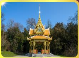
ศาลาไทยไชยานท์

GO3CDG-TG058 • ชมมหาวิหารแห่งเมืองมิลาน 8 วัน | 5 คืน