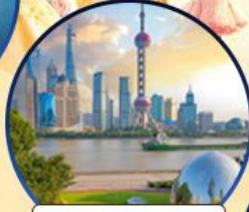
นอร์ทบัน กรีนแลนด์