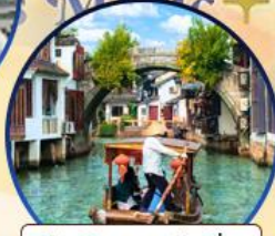
เมืองโบราณจูเจียเจีย