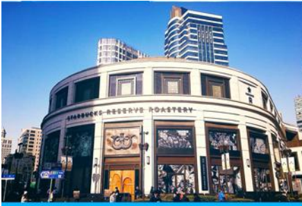
Starbucks Reserve Roastery