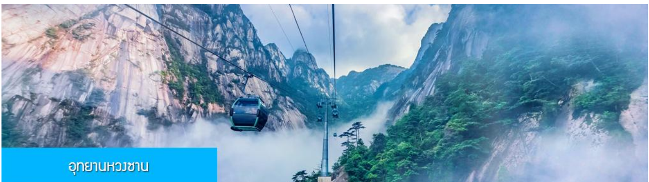
อุทยานหวงซาน