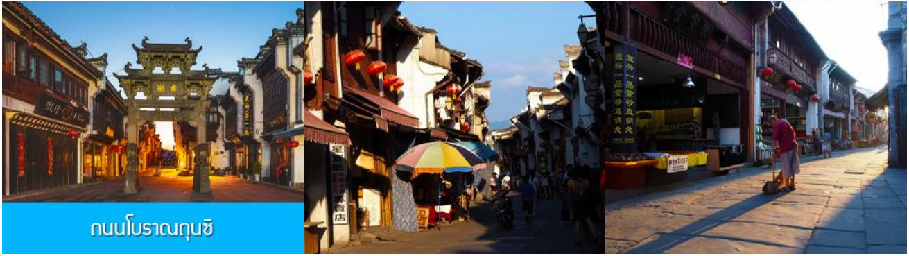
ถนนโบราณถุนซี

นำท่านเที่ยวชม ถนนโบราณถุนซี 屯溪老街 ถนนที่เป็นย่านการค้าโบราณในยุคราชวงศ์ซ่งได้แก่อายุกว่า 700 ปี ถนนมีความยาวราว 1272 เมตร สองฝั่งถนนมีอาคารบ้านเรือนโบราณสไตล์หุยโจวที่สร้างในยุคปลายราชวงศ์หมิงและราชวงศ์ชิงที่ถูกอนุรักษ์ไว้เป็นอย่างดี ปัจจุบันยังมีห้างร้าน โบราณ อาทิ ร้านขายโบราณวัตถุ ร้านขายหยก ร้านขายภาพเขียนและอักษรพู่กันโบราณ ร้านอาหารพื้นเมือง ร้านขายของที่ระลึก ฯลฯ นอกจากนี้ร้านค้าและอาคารบ้านเรือน โบราณที่นี่ยังเป็นแหล่งรวมของนักท่องเที่ยวที่มาชิมอาหารพื้นเมือง เดินช้อปปิ้งและถ่ายภาพ เซ็คอิน