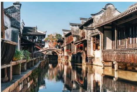
เมืองโบราณวูเจิน