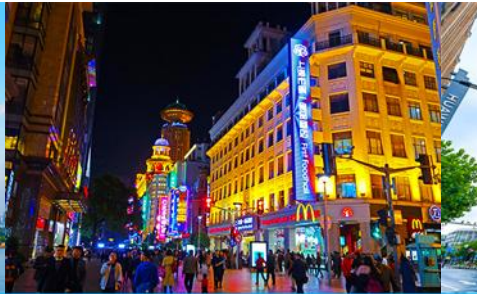
ถนนคนเดินหนานจิงลุ่