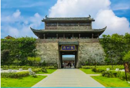
เมืองโบราณซูโจว