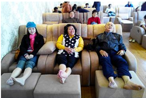
ศูนย์วิจัยแพทย์แผนจีน