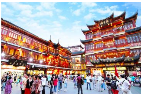
ตลาดเจิงหวงเมี่ยว

เช้า รับประทานอาหารเช้า ณ ห้องอาหารของโรงแรม (6)