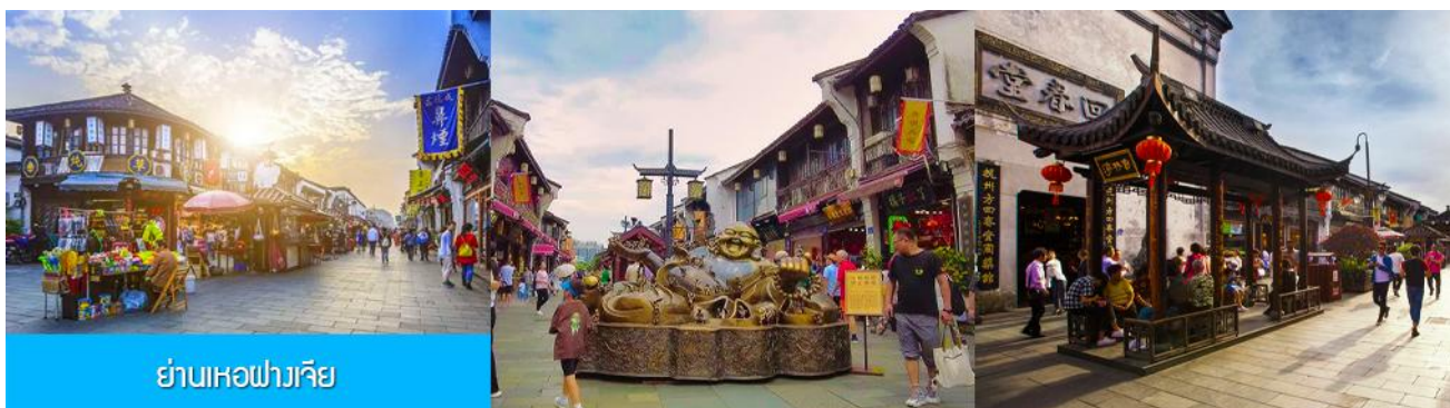
ย่านเหอฝางเจีย