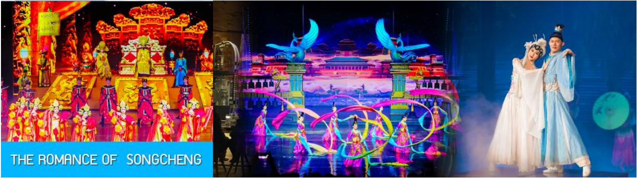
THE ROMANCE OF SONGCHENG