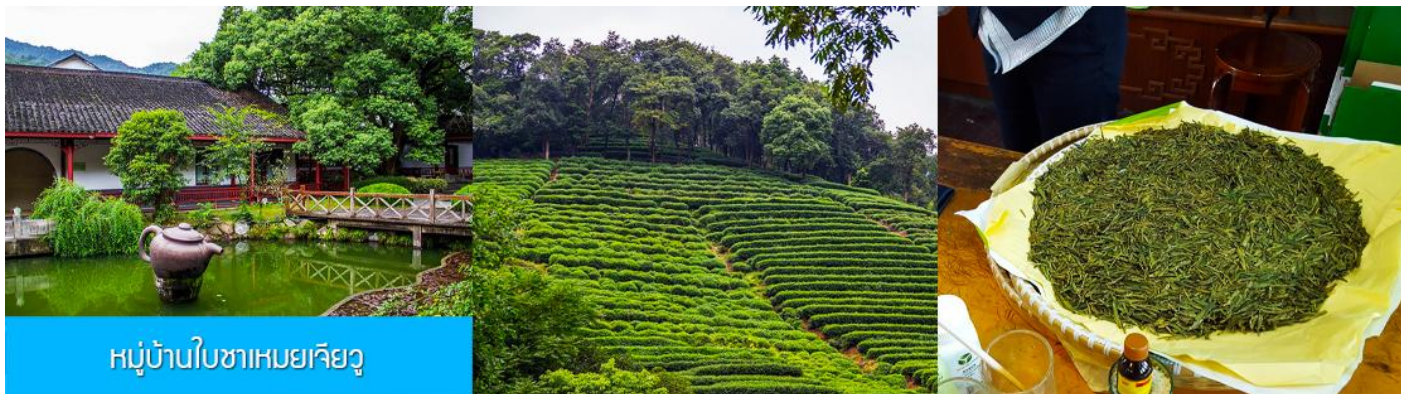
หมู่บ้านใบชาเหมยเจียว