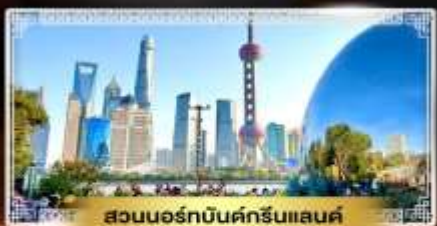
สวนนอร์มัลบิลด์กรีนแลนด์