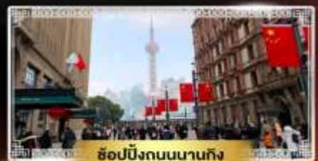
ช้อปปิ้งถนนนานกิง