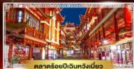
ตลาดร้อยปีเดินหวังเหมียว