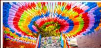
วัดลามะกว้างเหริน