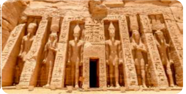
สมควรแก่เวลานำท่านเดินทางกลับเมืองอัสวาน