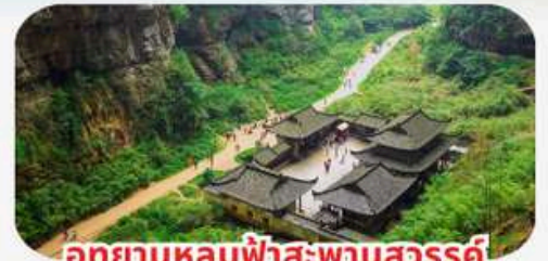
อุทยานหลุมฟ้าสะพานสวรรค์