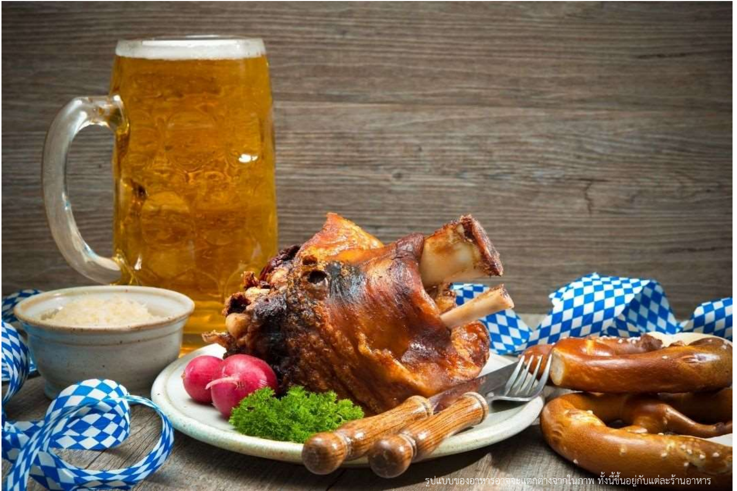
รูปแบบของอาหารอาจจะแตกต่างจากในภาพ ทั้งนี้ขึ้นอยู่กับแต่ละร้านอาหาร

วันที่สาม การ์มิสซ์ ปาร์เทินไครเชิน-ยอดเขาซูกสปีตเซ-เมืองซาลบูร์ก