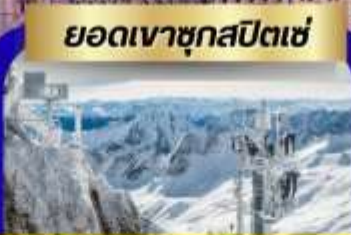
ยอดเขาซุกสปีตเซ่