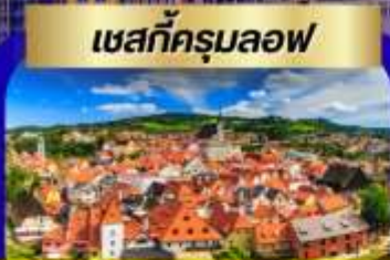
เชสท์ครุมลอฟ