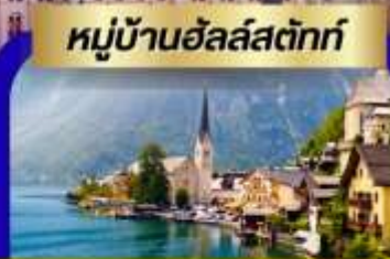
หมู่บ้านฮัลล์สตัดท์

ยอดเขาซุกสปีตเซ่ ล่องเรือแม่น้ำดานูบส์ เทียวหมู่บ้านฮัลล์สตัดท์ และ เมืองมรดกโลก เชสท์ครุมลอฟ