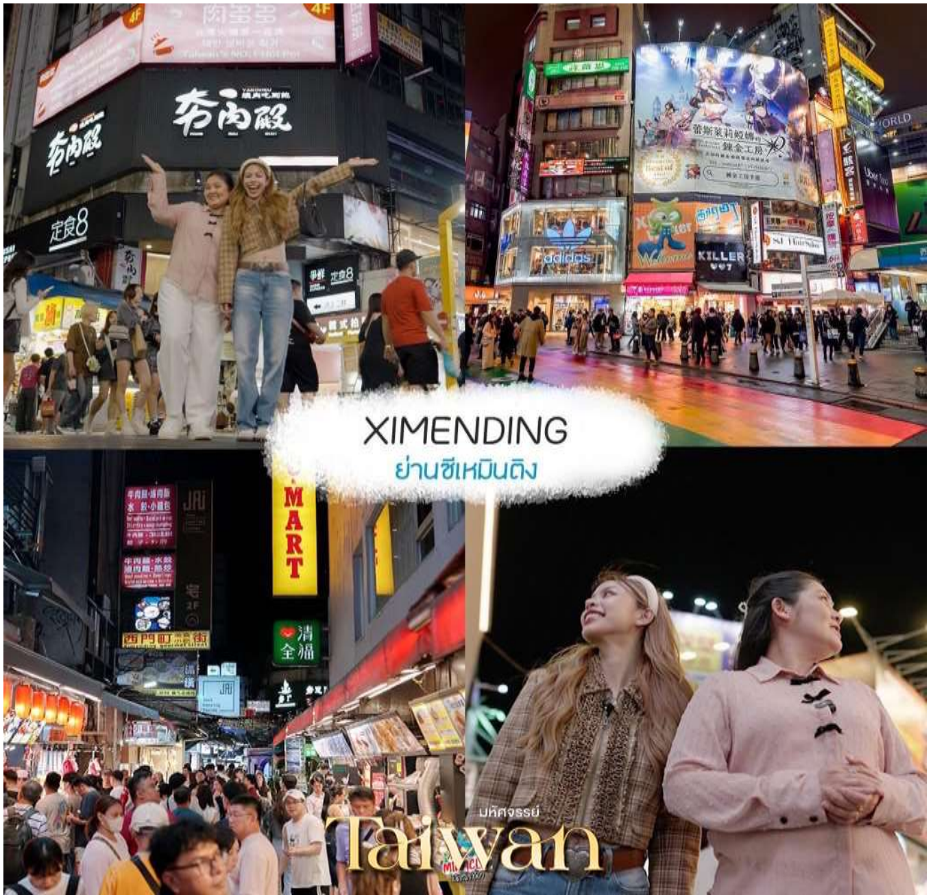
XIMENDING ย่านซีเหมินติง