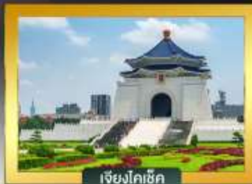
เจียงไคเช็ค