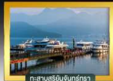
ทะเลสาบสุริยอันจันทร์ตรา