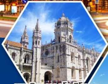
มหาวิหารเจอโรนิโม