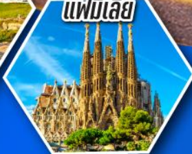
โบสถ์ซากราดา แฟมิเลีย