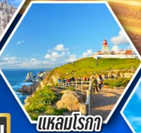
แควมโรกา