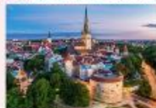
Tallinn Old Town