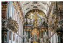
อารามจัสนา โกรา

** พักที่ Mercure Centrum Hotel 4* หรือเทียบเท่า **