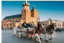
Krakow Old Town

05.15 น. เดินทางถึงสนามบินอิสตันบูล แวะเปลี่ยนเครื่อง 07.25 น. ออกเดินทางสู่สนามบินคราคูฟ เที่ยวบิน TK1271 08.45 น. เดินทางถึงสนามบินคราคูฟ ประเทศโปแลนด์