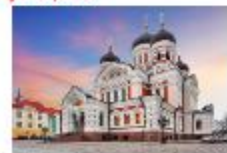
โบสถ์อเล็กซานเดอร์ เนฟสกี

19.35 น. ออกเดินทางสู่อิสตันบูล เที่ยวบิน TK1424