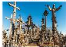
Hill of Crosses