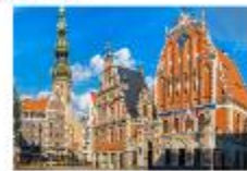
เมืองริกา

** พักที่ Bellevue Park Hotel Riga 4* หรือเทียบเท่า **