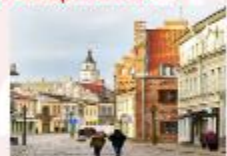
Kaunas Old Town

** พักที่ Holiday Inn Vilnius Hotel 4* หรือเทียบเท่า **