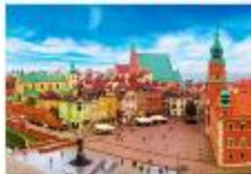
จัตุรัสเมืองเก่า