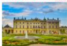
พระราชวัง Branicki