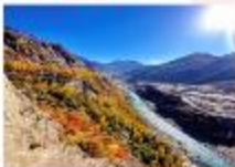
บ้อมปราการ Altit Fort

DAY4 บ้อมปราการอัลติท-ตลาดพื้นเมือง-ฮอปเปอร์ กลาเซียร์-หุบเขาคุดเกอร์