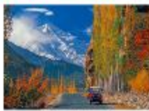
เมืองชิลาส

** พักที่ Shangrila Chilas Hotel หรือเทียบเท่า **