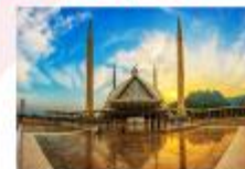
มัสยิดไฟซาล

DAY8 ตักศิลา-พิพิธภัณฑ์ตักศิลา-อิสลามาบัด-มัสยิดไฟซาล-Shopping-กรุงเทพ