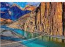
สะพานแขวนฮุสไซนี

DAY6 สะพานแขวนฮุสไซนี-กิลกิต-พระพุทธรูปคาร์กาห์