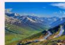
หุบเขา Naran Kaghan

** พักที่ Besham Hilton Hotel หรือเทียบเท่า **