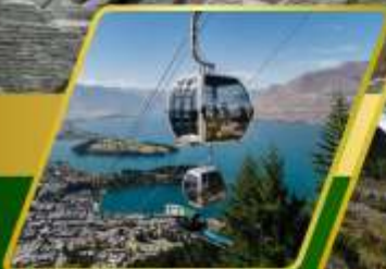
นั่งกระเช้าคอนโดล่า รับประทานอาหาร