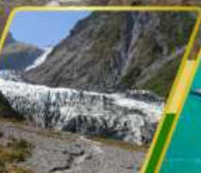
ธารน้ำแข็ง FOX GLACIER