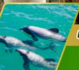
ส่องเรือชมโลมา