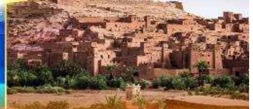
Kasbah of Ait Ben Haddou