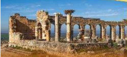
Roman City of Volubilis

เปิดประสบการณ์อนันต์ดาวสุดฟิน กลางทะเลทรายซาฮารา "Luxury Camp"