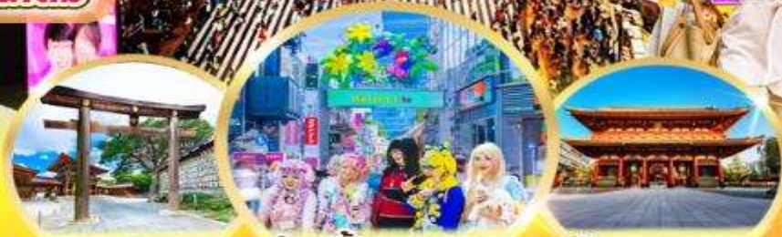
ศาลเจ้าเมจิ