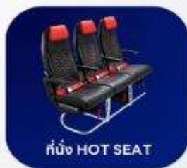
ที่นั่ง HOT SEAT