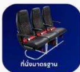
ที่นั่งมาตรฐาน