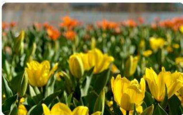
สวนโออิชิ ปาร์ค

สวนดอกไม้โออิชิ พาร์ค (Oishi Park) มหัศจรรย์แห่งวิวกุเขาไฟฟูจิ หนึ่งในจุดชมวิวของ ภูเขาไฟฟูจิที่สวยงามที่สุดอีกจุดหนึ่ง ที่จะเติมเต็มความสงบและความงดงามของธรรมชาติในญี่ปุ่นเมื่อ ไปเยือน คือสถานที่ที่ไม่ควรพลาด สวนดอกไม้โออิชิ พาร์ค (Oishi Park) แห่งนี้ไม่ได้เป็นเพียง สถานที่ที่มีดอกไม้สวยงามให้เราได้ชื่นชมแล้ว จุดเด่นของสวนนี้คือวิวกุเขาฟูจิที่อยู่เบื้องหลังสวน ดอกไม้สีสันสดใส ที่บานสะพรั่งในทุกฤดูกาล และยังเป็นมุมที่ให้เราสัมผัสกับวิวกุเขาฟูจิได้อย่าง ใกล้ชิด จากนั้นนำพาทุกท่านสู่..