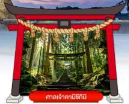
ศาลเจ้าคามิซึกิมี