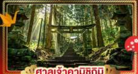
ศาลเจ้าคามิซึกิมิ