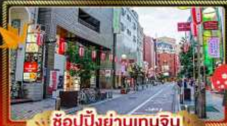
ช้อปปิ้งย่านเทนจิน