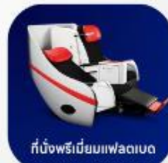
ที่นั่งพรีเมียมแพดเบด