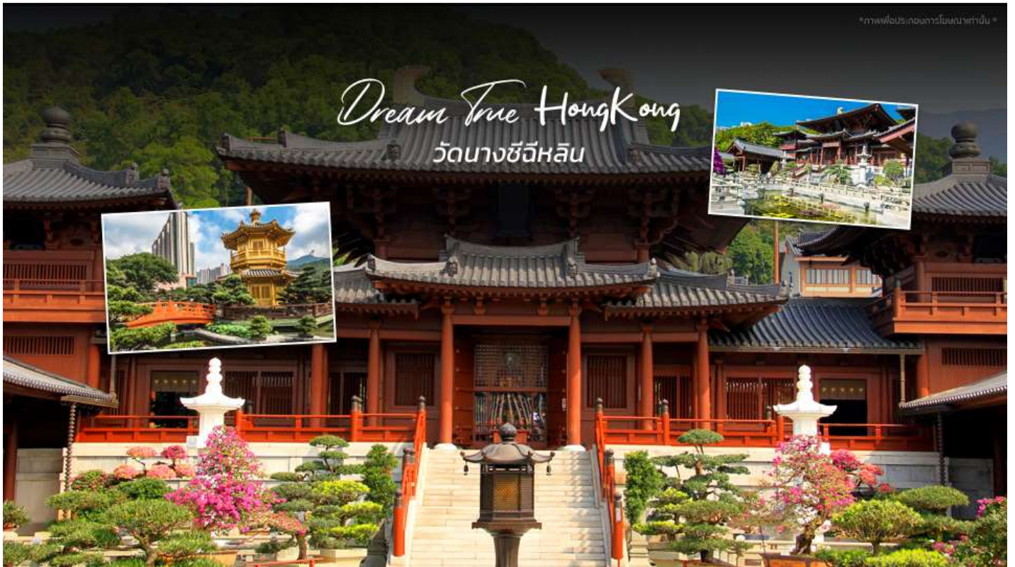
*ภาพเพื่อประกอบการโฆษณาเท่านั้น*