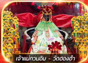
เจ้าแม่ทวนอิม - วัดฮ่องกง