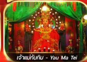
เจ้าแม่ทับทิม - Yau Ma Tei

มูจิ๊ดเต็ม 9 วัด ไทด์ท้องถิ่นนำสวดขอพรตามต้นฉบับท้องถิ่น