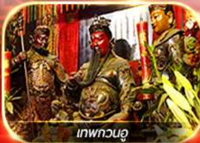
เทพกวนอู