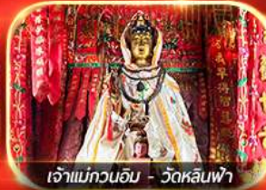
เจ้าแม่ทวนอิม - วัดหลินฟ้า