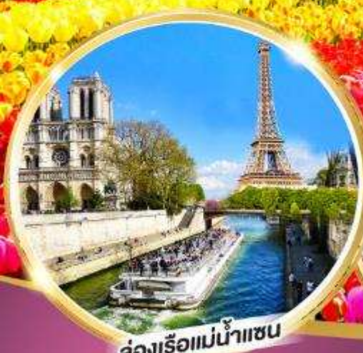
ล่องเรือแม่น้ำแซน