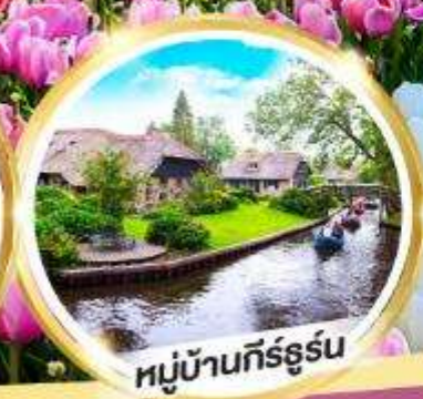
หมู่บ้านกิร์ธูร์น