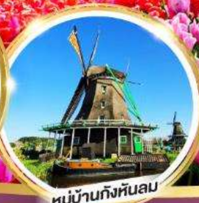
หมู่บ้านกังหันลม