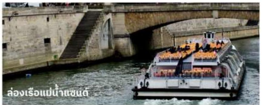
ล่องเรือแม่น้ำแซนต์

จากนั้นนำท่าน ล่องเรือบาโตมุช (Bateaux Mouches River Cruise) เรือล่องไปตามแม่น้ำแซน ที่ไหลผ่านใจกลางกรุงปารีส ชมความสวยงามของสถาปัตยกรรมอันคลาสสิกของอาคารต่างๆ