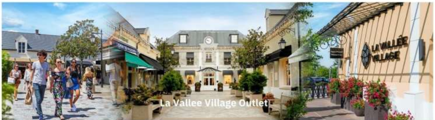
La Vallee Village Outlet