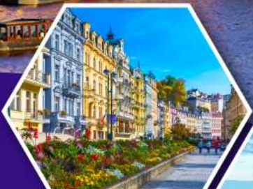
คาร์ลสบาด