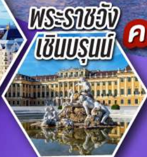
พระราชวัง เซินบรุนน์

เข้าชม ความงดงามและความอลังการ ของพระราชวังเซินบรุนน์