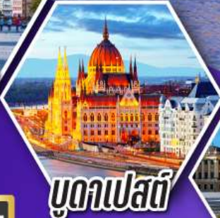
บราติสลวา