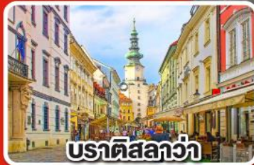
ปราติสลาว่า

เที่ยวเมือง คาร์โลวารี เมืองแห่งสปา พร้อมเมนูพิเศษเปิดโบฮีเมีย