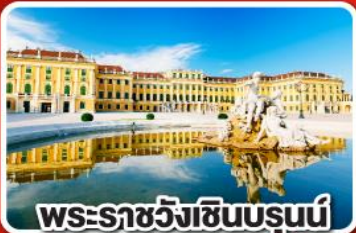
พระราชวังเซ็นบรูน์