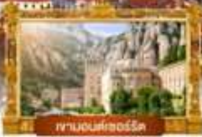
พิกานอนศักดิ์สิทธิ์