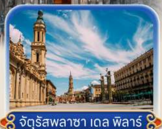
จัตุรัสพลาซ่า เดล ฟอรัส