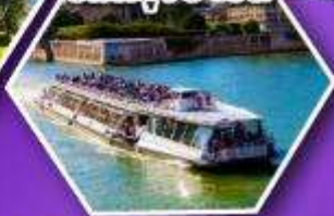
ล่องเรือบาโตมซ ชมกรุงปารีส

เที่ยวเมืองวาดูซ เมืองหลวงของสาธารณรัฐ ลิกเทนสไตน์