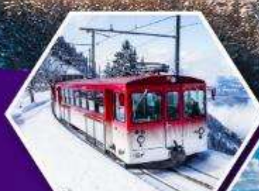
นั่งรถไฟใต้เขาริกิ