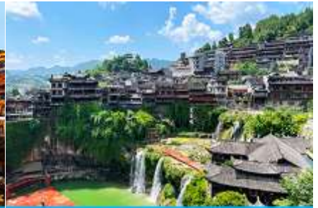
เมืองโบราณฝูหรงเจิ้น

วันที่สาม เมืองจางเจียเจีย-ศูนย์จำหน่ายผลิตภัณฑ์ยางพารา-ตึกมหัศจรรย์ 72 ชั้น-เมืองโบราณฝูหรงเจิ้น ยามค่ำคืน