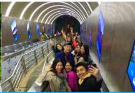
บันไดเลื่อนทะลุภูเขา