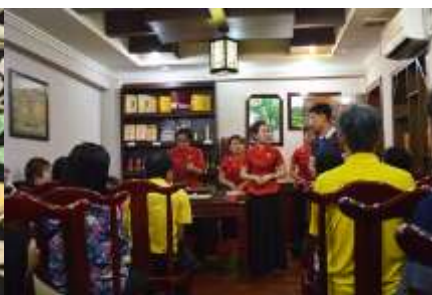
ร้านใบชา