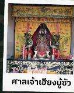
ศาลเจ้าเฮียงมู่ซิว