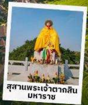
สุสานพระเจ้าตากสิน มหาราช