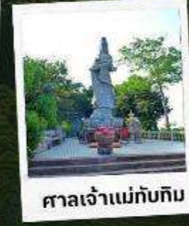
ศาลเจ้าแม่ทับทิม