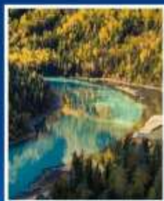
ทะเลสาบมังกรหลับ