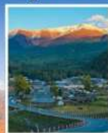
หมู่บ้านไปฮาปา