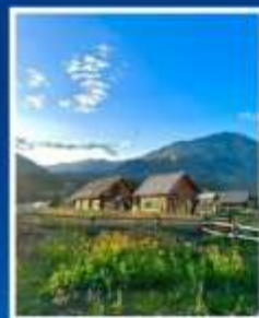
หมู่บ้านเหม่อผู้ซุน