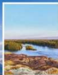
ธารน้ำ 5 สี