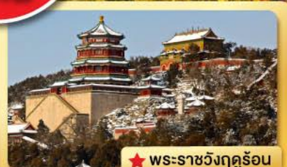
★ พระราชวังฤดูร้อน