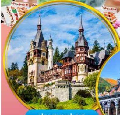
ปราสาทเปเลส