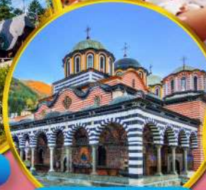
อารามมรดกโลกริลา

บุกดินแดนแห่งรัตติกาล ชมเทศกาลกุหลาบ 1 ปี มีเพียงครั้ง สัมผัสวิถีชีวิตชนพื้นเมือง เยือนเส้นทางมรดกโลก