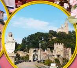
ป้อมชาเรเวทส์