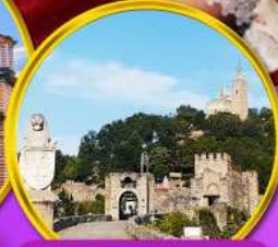
ป้อมชาเรเวทส์