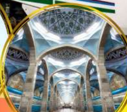
รถไฟฟ้าใต้ดิน